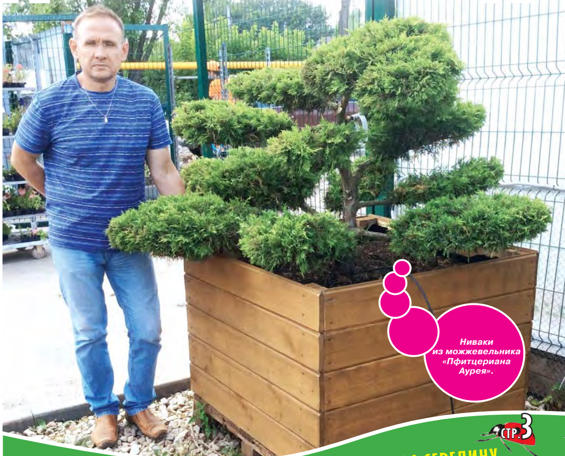
Ниваки из можжевельника «Фитцериана Аурея».